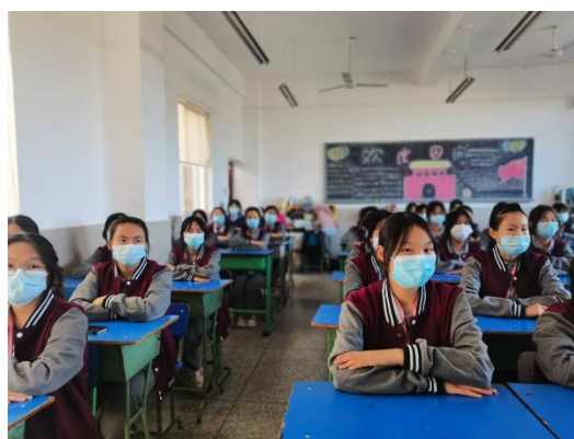
同学们专注于课堂