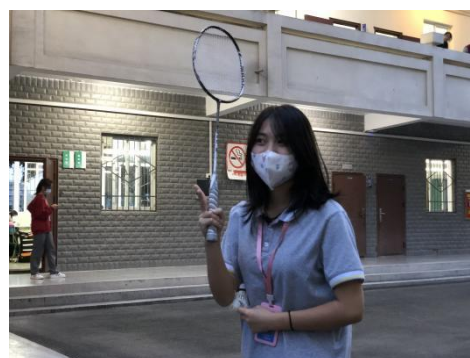
体育运动，强身健体