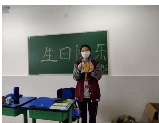
别样的生日，别样的惊喜